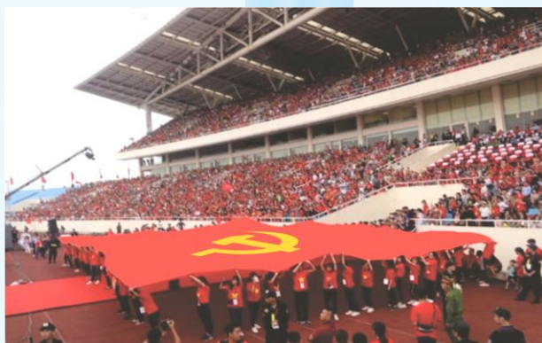
Hình 24a (rước cờ vai)