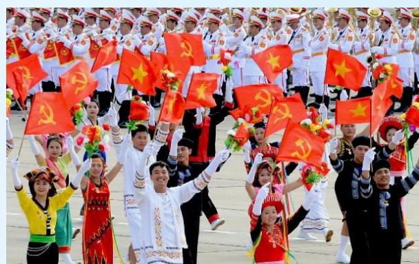
Hình 23d (vẫy bằng tay)