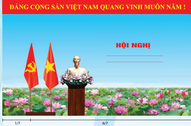
Hình 2 (Cờ có cán)