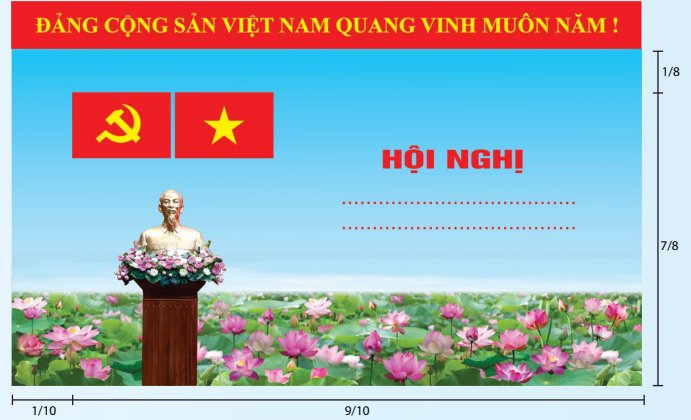
Hình 3a (cờ không tạo sóng)