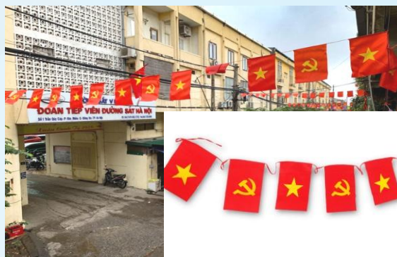
Hình 16b (cờ dây)