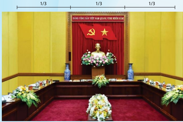
Hình 4b (kích thước hội trường nhỏ)