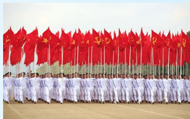
Hình 24b (rước theo hàng)