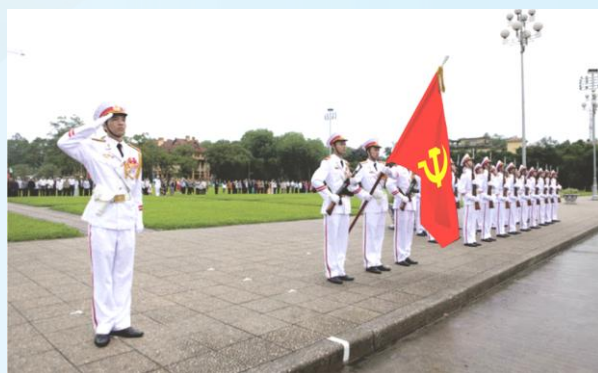
Hình 23b (giương cờ)