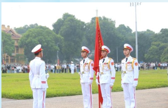
Hình 23a (cầm cờ)