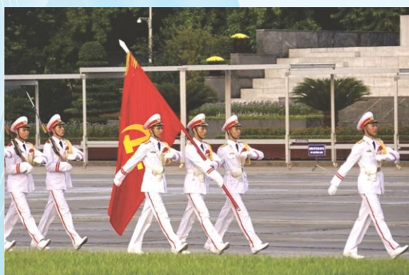
Hình 23c (vác cờ)