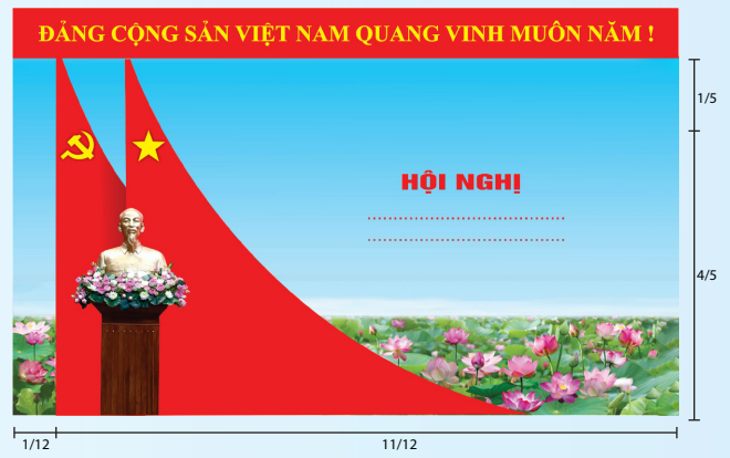
Hình 5c (cờ xếp chéo đôi)