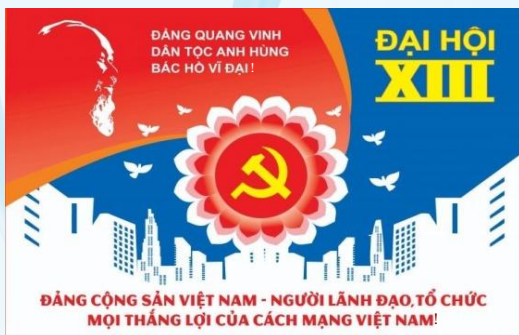
Hình 31b (panô tuyên truyền)