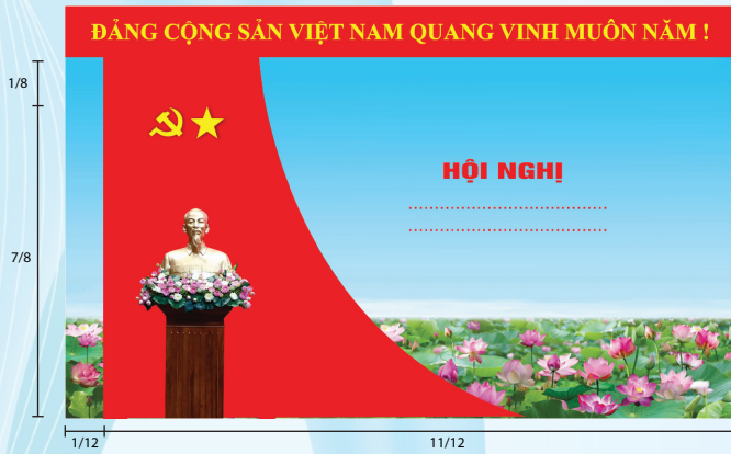
Hình 5b (cờ xếp chéo đơn)