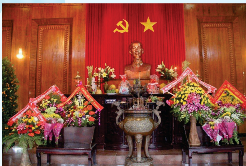
Hình 21c - Trong đền thờ chính

Điều 12. Nơi tổ chức các hoạt động đối ngoại đảng, ngoại giao nhà nước