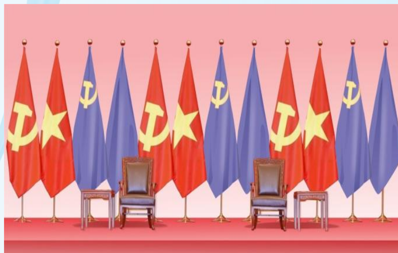
Hình 22 - (2 cờ màu tím là minh họa cờ Đảng và Quốc kỳ nước khách)

Điều 12. Nơi tổ chức các hoạt động đối ngoại đảng, ngoại giao nhà nước