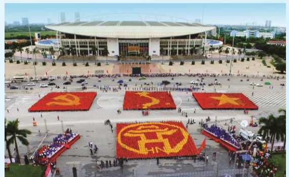
Hình 32 (xếp bằng người)