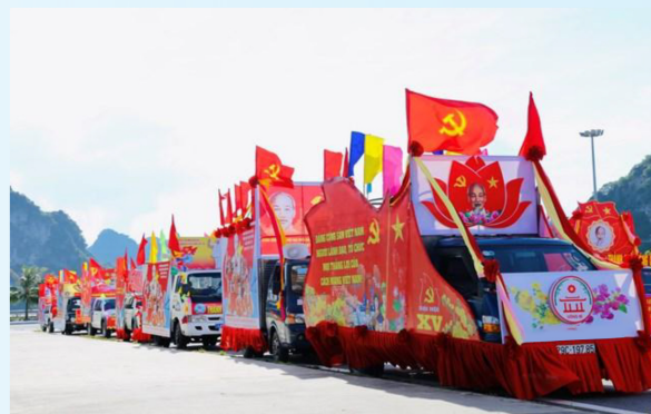
Hình 24d (rước bằng xe)