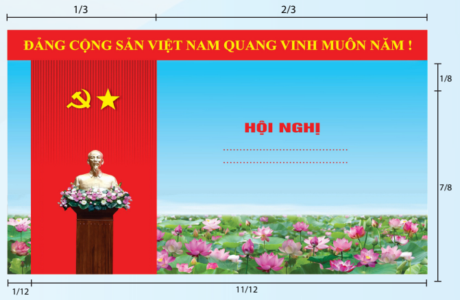
Hình 5a (cờ xếp dọc)