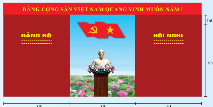
Hình 4a (kích thước hội trường rộng)